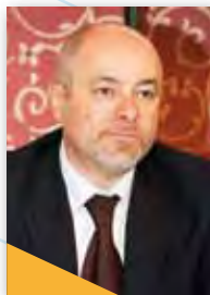
Segretario di Stato allo Sport SPORTS MINISTER On. Fabio Berardi